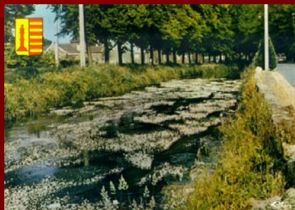
La Berwinne traverse le village de Mouland.